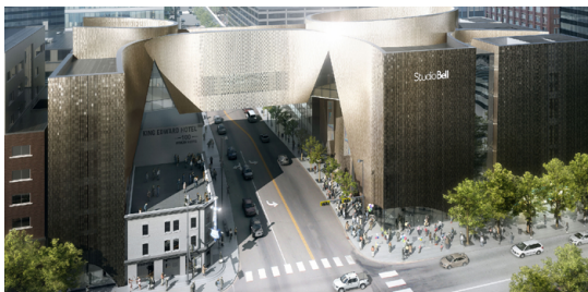
Studio Bell aerial rendering, credit: Allied Works Architecture

Pour en savoir plus, visitez Bell.ca/Cause .